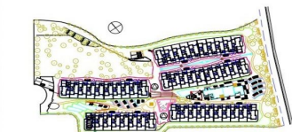
bloque 1 ordenacion general