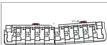
bloque 1 planta primera